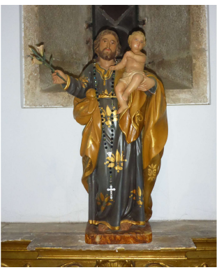
S. José, imagem de pau santo do Sec XVIII, oferecida gentilmente por uma paroquiana. Pode venerá-lo no seu altar da Matriz de Alcabideche.